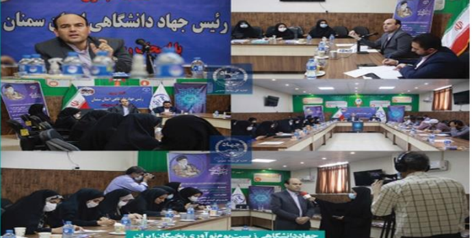
رئیس جهاد دانشگاهی استان سمنان در حین سخنرانی در جلسه توجیهی طرح های فناورانه جهاد دانشگاهی استان سمنان.

محمول گفت: ما علاوه بر مایع معدنی بلانستاده تولید می شود می تواند به مقایسه با بیابان های و جلوزیری از کرد و غبار و در استان و کشور کمک کند. متصفی راد از کود ارگانیک به عنوان یک محصول فناورانه جهاد دانشگاهی استان نام برد که در مرحله تولید آزمایشگاهی نیز رسیده افزود: این کود ارگانیک نیز به پایه باغچه ها تولید شده و جهاد دانشگاهی به دنبال تجاری سازی آن است.