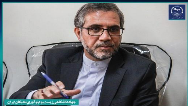
جهاد دانشگاهی زیست‌بوم نوآوری نخبگان ایران