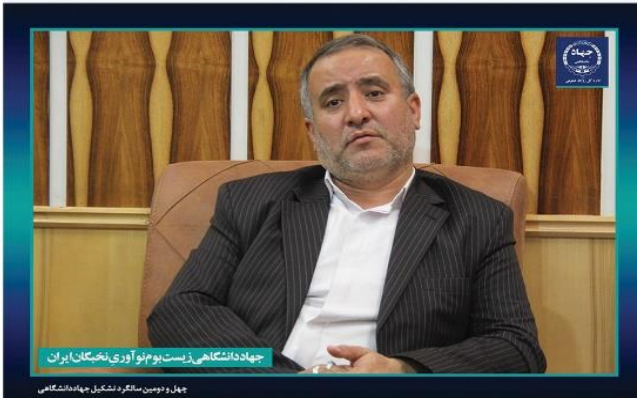
جهاد دانشگاهی زیست بوم نوآوری نیشکان ایران