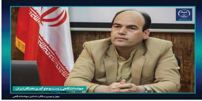
رئیس جهاد دانشگاهی استان سمنان در حین سخنرانی در جلسه توجیهی طرح های فناورانه جهاد دانشگاهی استان سمنان.