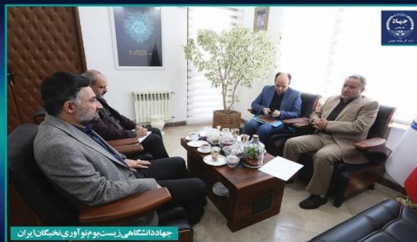
چهار دومیین سالگرد تشکیل جهاد دانشگاهی

رییس جهاد دانشگاهی در نشست مشترک با استاندار سمنان با اشاره به ظرفیت‌ها و پتانسیل‌های خوبی که در این استان وجود دارد گفت: مأموریت‌های ملی برای جهاد دانشگاهی سمنان تعریف و ابلاغ شده است.