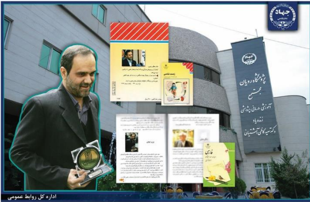
اداره کل روابط عمومی

عین همین قضیه در مورد سلول‌های بنیادی به وجود آمد. بنده چندبار پیشرفت‌های سلول‌های بنیادی را در چند سخنرانی بر زبان آورده بودم. از دانشمندان کشور و از بعضی از دانشگاه‌ها به من نامه نوشتند: آقا! این قضیه را شما این قدر نگوئید، این واقعیت ندارد؛ این جور نیست! اینی که می‌گوئید در سلول‌های بنیادی پیشرفت کرده‌اند و در شبیه‌سازی (کلونینگ) دارند تمرین و کار می‌کنند، باور نکنید؛ چنین چیزی اتفاق نیفتاده و نخواهد افتاد! بعد که گوسفند شبیه‌سازی شده را جلو چشم همه قرار دادند، بعد که در سمیناری که تشکیل دادند، دانشمندان معروف دنیا، زیست‌شناس‌های درجه‌ی یک دنیا آمدند مصاحبه کردند و تصدیق کردند که پیشرفت‌ها، پیشرفت‌های محیرالعقولی است، آن وقت یک عده از دیرباورها باور کردند!»