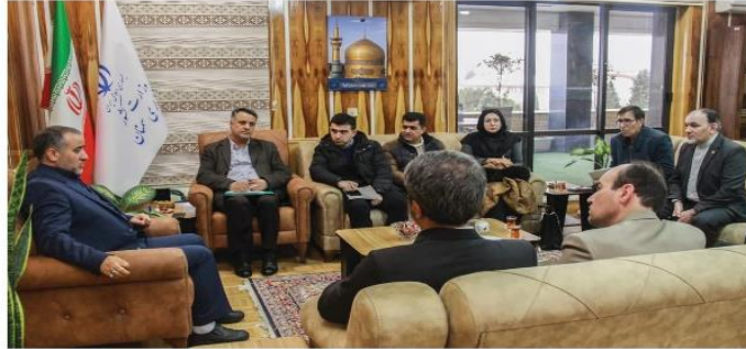
رئیس جهاد دانشگاهی استان سمنان در دیدار با استاندار سمنان در خصوص اجرای طرح ملی غربالگری سرطان زنان در ۱۱ استان کشور