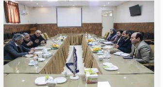
نشست بررسی همکاری جهاد دانشگاهی استان سمنان و خیرین سلامت جهت تهیه ساختن درمانگاه تخصصی دیابت و ترمیم زخم در سمنان