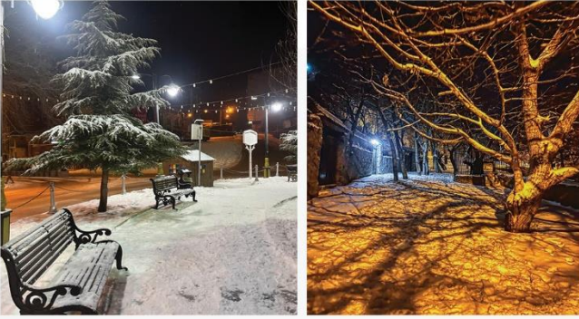
بارش برف زمستانی - شه میرزاد