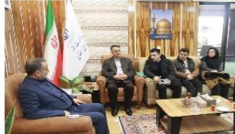
رئیس سازمان جهاد دانشگاهی علوم پزشکی تهران گفت: با تلاش و همکاری همکاران ما در مجموعه جهاد دانشگاهی استان سمنان، موافقت اصولی تأسیس درمانگاه تخصصی دیابت و درمان زخم جهاد دانشگاهی استان سمنان صادر شده است و انشاءالله خدمات تخصصی در حوزه ترمیم زخم دیابت در استان سمنان ارائه خواهد شد.