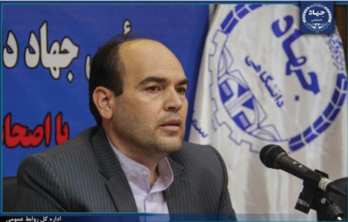
اداره کل روابط عمومی