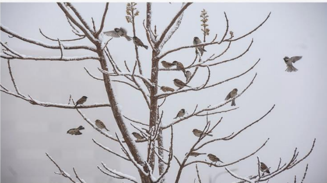
صبح برفی بهمن ماه - سمنان